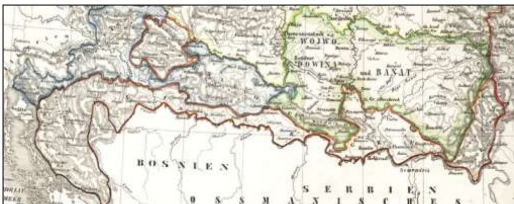
Карта бр. 2: Војна крајина у Хабзбуршкој монархији

Јужнословенске земље су у различитим периодима потпале под власт Хабзбуршке монархије. Хрватска је још од 1102. године била у персоналној унији са Мађарском (1102-1526. са извесним краћим прекидима), а касније је постала и део Хабзбуршке монархије (1526-1818). У временском раздобљу након успостављања Аустроугарске током 1868. године била је створена Краљевина Хрватска, Славонија и Далмација (нем. Königreich Kroatien und Slawonien ) са властитим Сабором, владом и баном. У циљу што боље одбране Хабзбуршке монархије у оквиру данашње Хрватске и на територији Војводине била је створена Војна крајина. 5 Ови погранични делови Аустроугарске према Отоманском царству били су углавном настањени Србима насељеним из других делова суседне царевине, али је Војна Крајина 1881. године била припојена Краљевини Хрватској, Славонији и Далмацији и de facto престала да постоји. На овај начин су и етнички Срби интегрисани у потпуности у састав данашње Хрватске, а њихови покушаји да током распада некадашње југословенске државе (1991-1995) успоставе одређени вид територијалне аутономије на овом подручју у оквиру тзв. Републике Српске Крајине нису дали никакве резултате. 6 Овим је, у историјском контексту, суштински минимализован српски етнички корпус на територији данашње Републике Хрватске и поред чињенице да су они били конститутивни народ у овој бившој југословенској републици од 1945. до 1990. године.