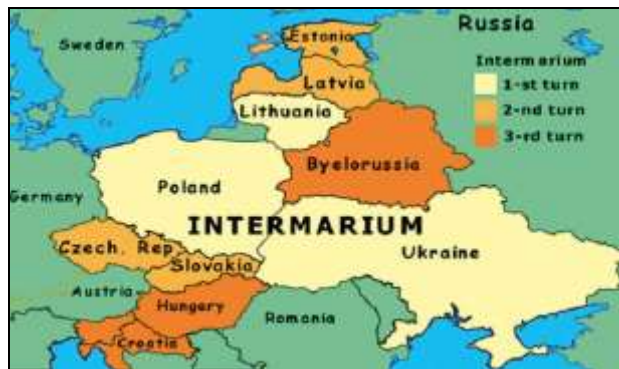
Карта бр. 3: Пројекат Интермарум - Међуморје